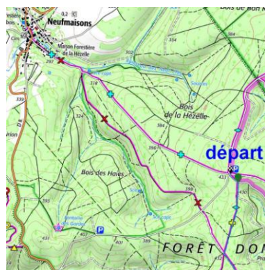
COTATION D'UNE RANDONNÉE PÉDESTRE EN MOYENNE MONTAGNE

Attention : La fiche PDF ouvre un aperçu de la randonnée mais elle ne remplace en aucun cas une carte IGN indispensable en randonnée.