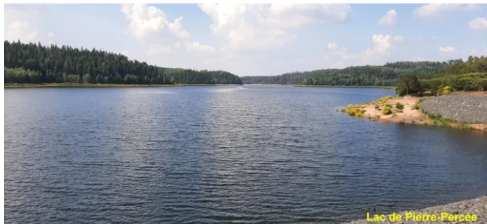
Lac de Pierre-Percée